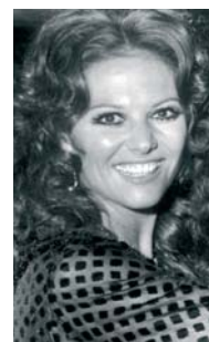
Claudia Cardinalová nar. 15. dubna 1939