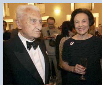
Tomáš Baťa s manželkou