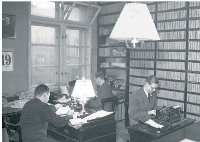
Historický pohled do jedné z redakcí ČTK