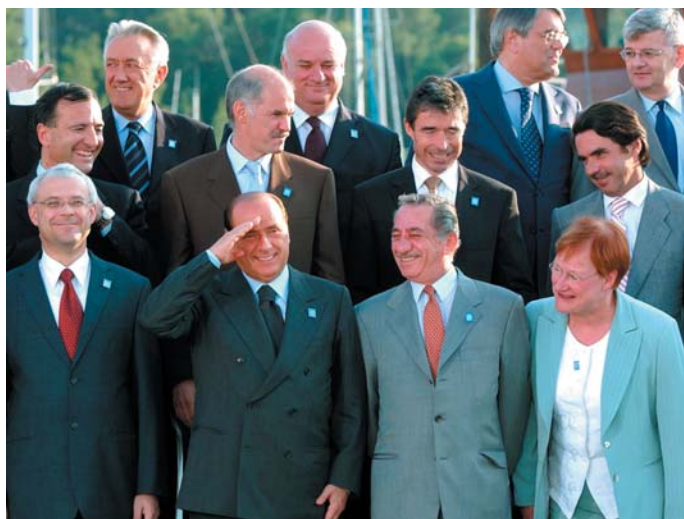
Společné fotografování v řeckém portu Korrás, kde 20. června pokračoval třídenní summit Evropské unie - v první řadě zleva Vladimír Špidla, italský premiér Silvio Berlusconi, kyperský prezident Tasos Papadopoulos a finská prezidentka Tarja Haloneová.

Další možnosti zdrojů informací o EU, zprostředkované Českou tiskovou kanceláří: