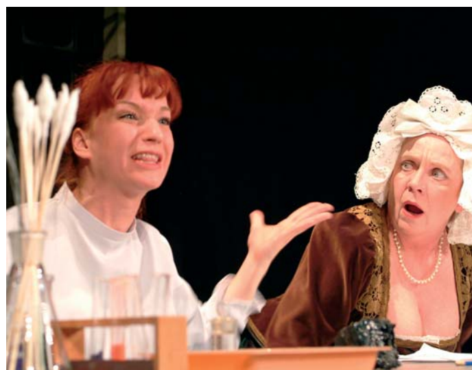
Z divadelní hry „...nebylo by libo Nobela?“

Divadlo chystá nová vlastní představení, svůj repertoár ale obohatí také o pořady pro děti, besedy, koncerty a budou zde hostovat soubory ze zahraničí.