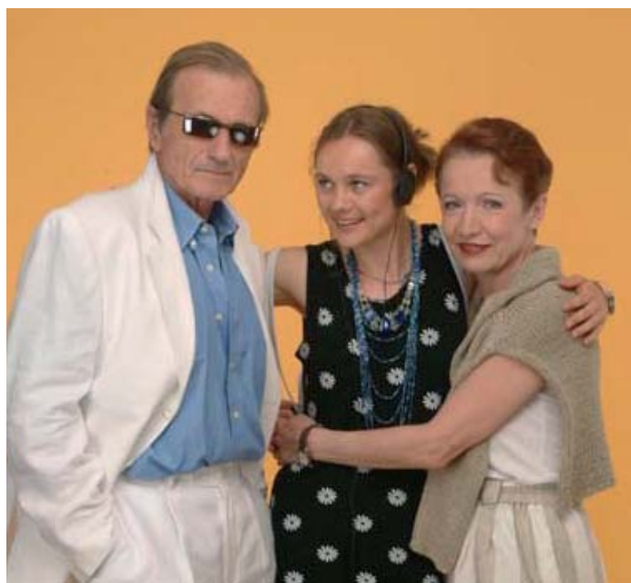
Z divadelní hry „Chvilková slabost“