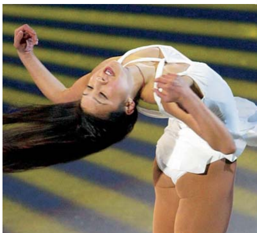
Američanka Michelle Kwanová během exhibice uspořádané 28. března na závěr mistrovství světa v krasobruslení v Dortmundu.

- průběžně aktualizovaná databáze obsahující téměř 2500 dokumentů s údaji o sportovním dění v ČR a ve světě. Naleznete zde přehledy mistrů světa, Evropy a ČR v jednotlivých sportech, výsledky dalších vrcholných mezinárodních soutěží, vývojové tabulky světových a českých rekordů či statistické přehledy. Vybírat můžete z více než 75 sledovaných sportů, včetně mladých, dynamických a okrajových disciplín.