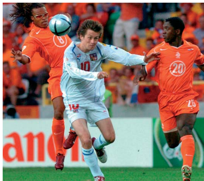
Tomáš Rosický s Holanďany Edgarem Davidsem vlevo a Clarencem Seedorfem vpravo v průběhu zápasu skupiny D na mistrovství Evropy ve fotbale Euro 2004 19. června 2004 v Portugalsku.

- užitečný nástroj pro každého, kdo potřebuje podrobné údaje o českém i zahraničním fotbale. Ve srovnání s veřejně přístupnými zdroji v ní klienti naleznou mnohem podrobnější a komplexnější informace a především v ní mohou vyhledávat podle kritérií, která jim nejvíc vyhovují. Je zaměřena na evropský fotbal a obsahuje základní údaje o všech reprezentačních mužstvech a o více než 10 000 hráčích, kteří se od roku 1994 objevili v reprezentačním týmu některé z 52 členských zemí UEFA. Dále je zde zahrnuto 25 fotbalově nejvýznamnějších mimoevropských zemí - všech, které se od roku 1994 účastnily mistrovství světa ve fotbale. Část nazvaná Fotbal - liga přináší podrobné informace o české fotbalové lize od jejího vzniku v roce 1993, základní údaje o všech ligových hráčích, přehledy vzájemných zápasů a mnoho dalších statistických údajů, které mají velké využití v každodenní novinářské práci i v publicistice.