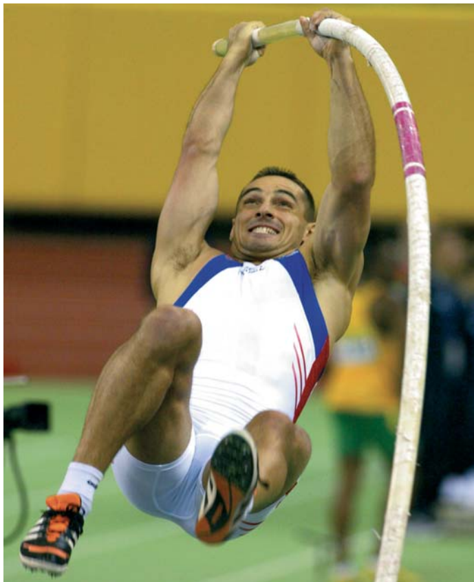
Roman Šebrle při skoku o tyči 7. března 2004 na atletickém halovém mistrovství světa v Budapešti.

KROMĚ SPORTOVNÍHO ZPRAVODAJSTVÍ MÁ ČTK VE SVÉ NABÍDCE PRO VŠECHNY ZÁJEMCE O INFORMACE SE SPORTOVNÍ TEMATIKOU PŘIPRAVENY TAKÉ PODROBNĚJŠÍ ÚDAJE A STATISTIKY, KTERÉ JSOU OBSAŽENY V DATABÁZÍCH SPORTY A FOTBAL.