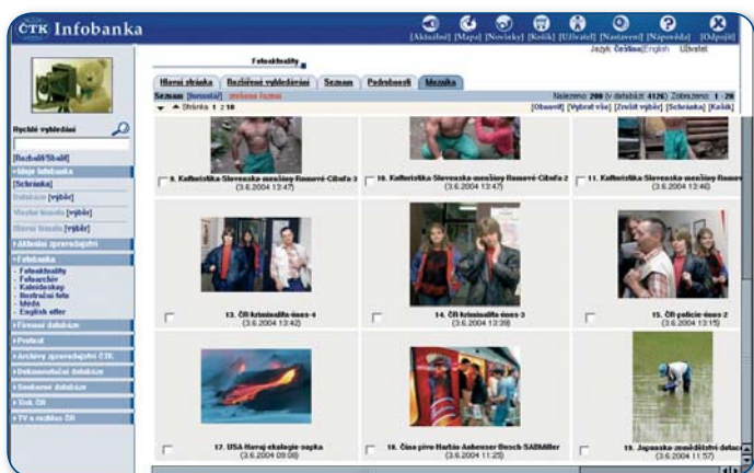
Snadné vyhledávání ve Fotobance podle zadaných kritérií přes internet umožňuje uživatelský přívětivé prostředí Infobanky ČTK.