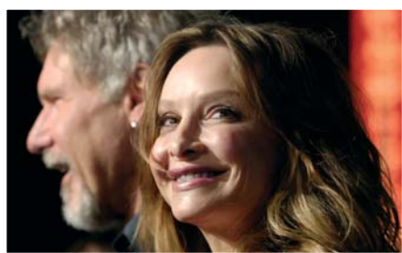
Hrdinka ze seriálu Ally McBealová , Calista Flockhart, se svým přítelem Harrisonem Fordem.

Velkým přínosem pro zahraniční zpravodajství je exkluzivní zastupování americké agentury The Associated Press (AP) v České republice. Její fotografie ověřené 29 Pulitzerovými cenami jistě není nutné představovat. Aktuální všeobecný servis agentury AP přináší denně více než 1500 fotografií z celého světa a pokrývá veškeré aktuální dění od politiky a ekonomiky po zajímavosti ze sportu a showbyznysu.