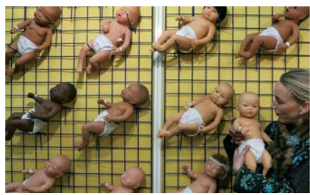
Veletrh hraček v Norimberku.

Výběr zhruba 150 fotografií poskytujeme v rámci denního servisu fotoaktualit ČTK. Plný servis AP, obsahující asi 1500 fotografií denně, dodáváme jednak přes Fotobanku ČTK nebo přes satelit. Zprostředkováváme rovněž přístup k centrální fotobance agentury AP v New Yorku s více než dvěma miliony on-line fotografií a více než 10 miliony v archívech.