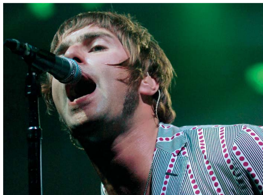
Zpěvák Liam Gallagher a rocková kapela Oasis. V nabídce Fotobanky ČTK najdete též fotografie z řady dalších agentur jako jsou např. EMPICS, DPA či LEHTIKUVA.

V průběhu letošního roku připravujeme vedle změn v obsahu i novou grafickou tvář Fotobanky ČTK, která umožní lepší orientaci a snazší vyhledávání žádaných fotografií. Věříme, že všechny uvedené změny přispějí k větší spokojenosti našich zákazníků při využívání denního servisu fotoaktualit i celé Fotobanky.