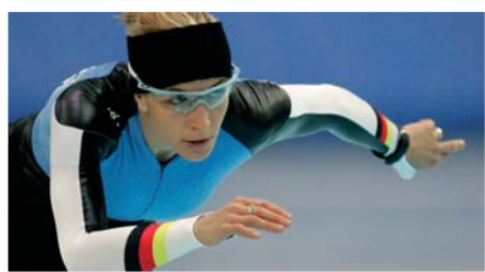
Německá rychlobruslařka Anni Friesinger.