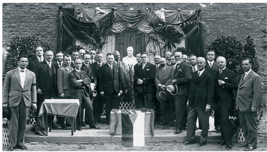
Slavnostní položení základního kamene budovy ČTK v Opletalově (tehdejší Lützowově) ulici v Praze v roce 1928.